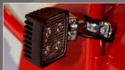
Illuminazione a led 12W - 24V mod: PN01020 2.0