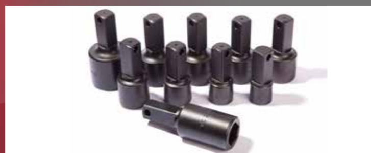
bussole di varie misura (optional)