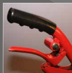
Controllo elettronico a leva (mano sinistra)

La storia di Global Team risale al passato. Come spesso accade, è iniziata in un piccolo garage. La necessità di facilitare l'allentamento dei dadi delle ruote di veicoli pesanti particolarmente arrugginiti e logorati dal tempo, è stata ideata la base per la macchina PN01020 e con notevoli migliorie prodotta ancora oggi.