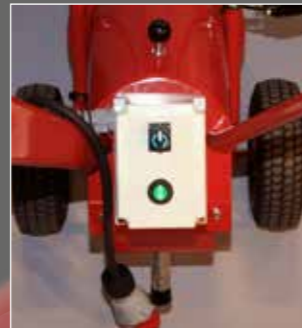
Controllo elettronico START & STOP (mano destra)